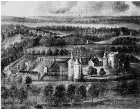
“Het Huys van Steyn”.

Het gebied dat later de heerlijkheid “Land van Stein” zou worden, behoorde in 1128 aan het Bisdom Utrecht. Tien jaar later vermaakte de bisschop van Utrecht het gebied aan het kapittel van Oudmunster te Utrecht. In 1290