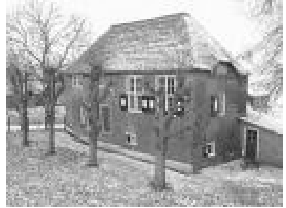
De hofstede Kloosterstein gebouwd ca. 1572, verbrand in 1900

Met de nog bruikbare stenen van het afgebrande klooster werd op een stuk grond naast het vroegere klooster een boerderij gebouwd: de hofstede Kloosterstein; deze boerderij brandde in 1900 af, waarna op dezelfde plek een nieuwe boerderij werd gebouwd.