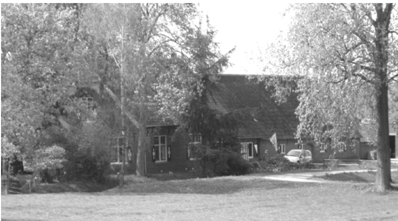
Boerderij “t Klooster” anno 2009

Deze nieuwe boerderij, 't Klooster genaamd, bestaat nog altijd en huisvest een Erasmuskamer. De lambrisering in deze kamer is -naar verluidt- gemaakt van de luiken van het voormalige klooster. In de kamer staat onder meer een antieke haard en een tafel, waaraan Erasmus gewerkt zou hebben. In de kamer staat bovendien een kinderstoel, die aan Desiderius Erasmus toebehoord zou hebben. In de zitting bevindt zich een handig rond gat en onderaan de kinderstoel zit een schuifje, waarachter een stoofje kan worden geplaatst. In de boerderij bevindt zich sinds 1936 een gedenksteen, die aangeeft dat Erasmus hier van 1488 tot 1493 heeft gewoond. Ook is er een ornament te zien uit 1519, dat versierd is met een wapen. Ditzelfde wapen siert ook de schouw boven de al genoemde haard. In het verleden zijn verscheidene pogingen gewaagd om de herkomst van dit wapen vast te stellen, tot op heden zonder resultaat. Tegenwoordig worden op boerderij 't Klooster op ambachtelijke wijze boerenkaas en andere zuivelproducten bereid.