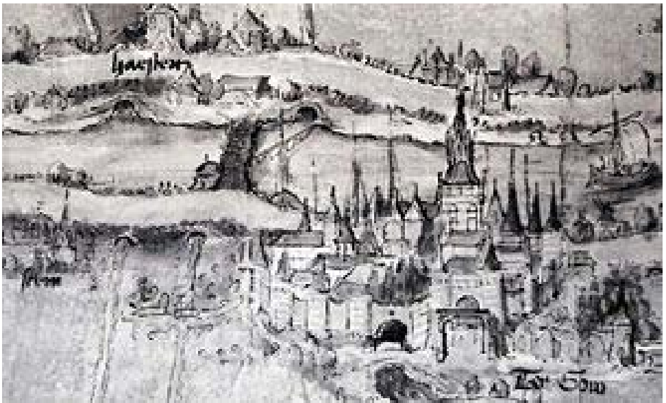
Klooster Stein 1419-1549

Van de kloosters in en om Gouda is Klooster Emmaus (Klooster Stein) historisch één van de meest interessante. Een aantal jaren was het de woonplaats van Erasmus. Gedurende het grootste deel van de tijd , dat de kloostergemeenschap van de Regulieren in het Land van Stein verbleef (1419-1549), oefende de stad Gouda gezag daarover uit.