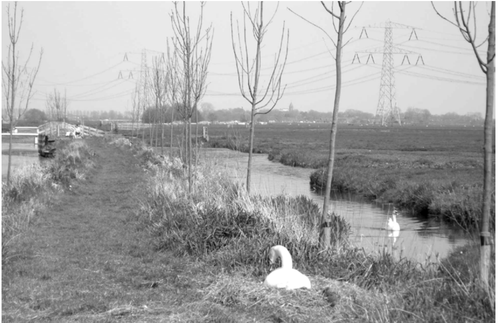
De Steinse Tiendweg