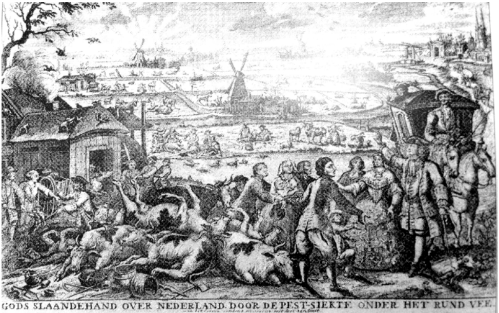
GODS SLANDEHAND OVER NEDERLAND DOOR DE PEEST-SIEKTE. ONDER HET RUND VEE.

Stein kende veel perioden van diepe “recessies” . Tijdens de Hoekse en Kabeljouwse Twisten werd het land regelmatig geplunderd. Dit was eveneens het geval tijdens de Tachtigjarige oorlog, toen rondtrekkende groepen soldaten voor veel overlast zorgden. Ook veeziekten zorgden voor veel armoede . In de 18 e eeuw wordt het gebied geteisterd door de veepest. Dit leidt tot veel financiële problemen en een sterk toegenomen aantal faillissementen (boelhuizen). In 1714 waren er zes boelhuizen in het Land van Stein. Stein had geen eigen kerk en benoemde daarom vanaf eind zestiende eeuw twee armenmeesters voor de plaatselijke armenzorg. Hun inkomsten haalden zij uit aalmoezen,