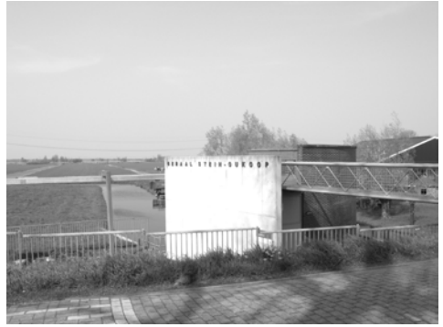
Twee gemalen van de polder Stein: Links "Stein" en rechts "Stein-Oukoop"

De polder Stein heeft, met enige naburige polders, gedurende lange tijd een afwijkende status gehad. Op 17 januari 1478, vóór de stichting als bemalen polder (met molen), vormde het gebied, met dat van de westelijke aangrenzende polder Willens, waterstaatkundig één geheel.